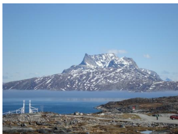
Figur 2- Udsigt til Sermitsiaq

Oplevelserne er mange på Grønland, hvilket gør at man sagtens kan få tiden til at gå i fritiden. Der er lige fra den fantastiske og storslået natur til kulturelle oplevelser. Ydermere er der gode træningsmuligheder, hvilket jeg selv har benyttet en del af. Ønsker man at se mere end selve byen er der muligheder for at købe sig adskillige ture, som turistforeningerne arrangerer, hvilket kan anbefales. Så alt i alt er der stor mulighed for at få en masse uforglemmelige oplevelser med i fritiden.