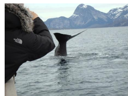
Figur 1- Hvalsafari - kaskelothval

Naturen i Grønland er helt exceptionel og er nok et af de steder i verden, der har det mest varierede og fantastiske natur. Grønland rummer mange forskellige naturoplevelser, både til lands, vands og i luften. Grønland er ligeledes rig på dyreliv, hvor der er mulighed for at opleve både rensdyr, moskusokser, ørne, ræve, sæler og ikke mindst hvaler. Isbjørne, som er det største rovdyr i Grønland, er også til at finde, men færdes normalt ikke i området omkring Nuuk. Denne sjældenhed er dog her i foråret 2009 blevet en realitet, da to isbjørne, med cirka 1 måneds mellemrum blev skudt tæt ved Nuuk.