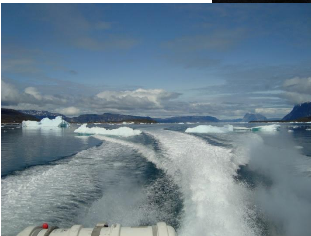
Figur 4- Sejltur til isfjorden